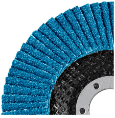
Fabricados con lija zirconia y cerámico