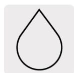
Uso en húmedo