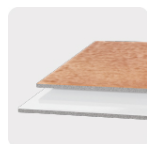
Loseta y azulejo